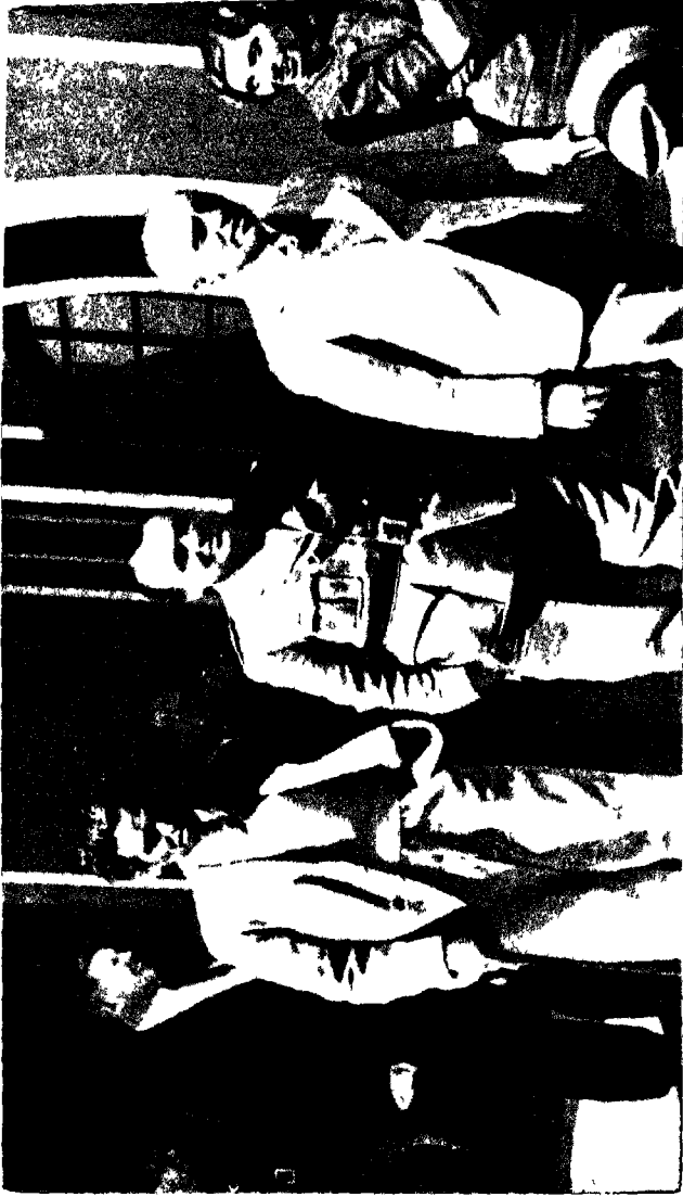
प० जवाहरलाल नेहरू : स्पेन में श्री बी. के. कृष्ण मेनन और जनरल लिस्टर के साथ